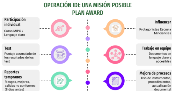
Imagen 4 Presentación - Plan Award